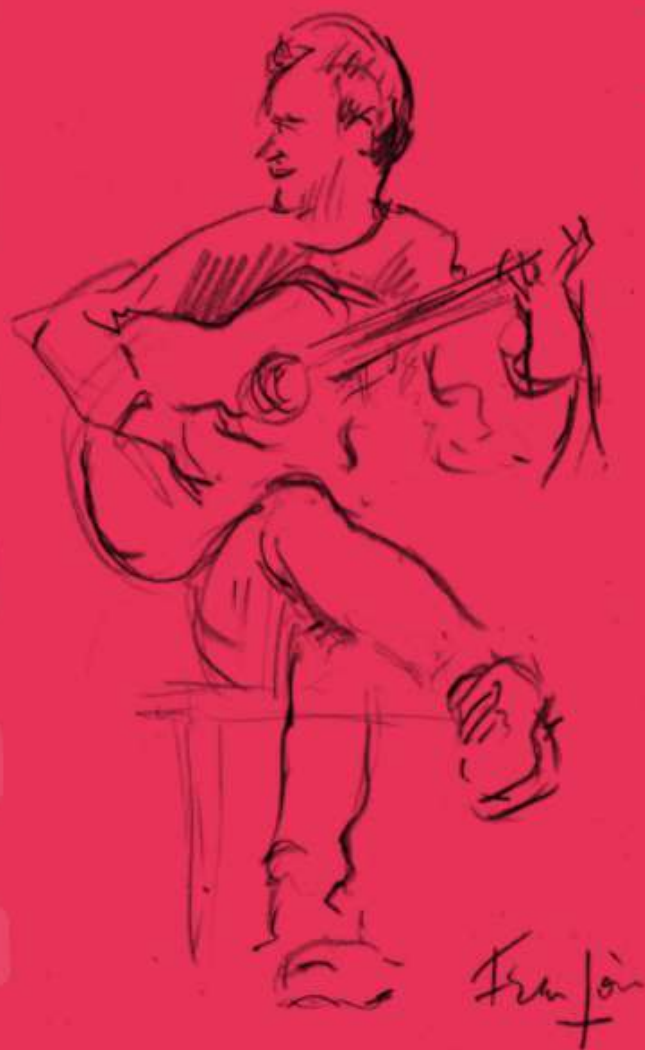
DESSIN : FRANÇOIS CONTESSE